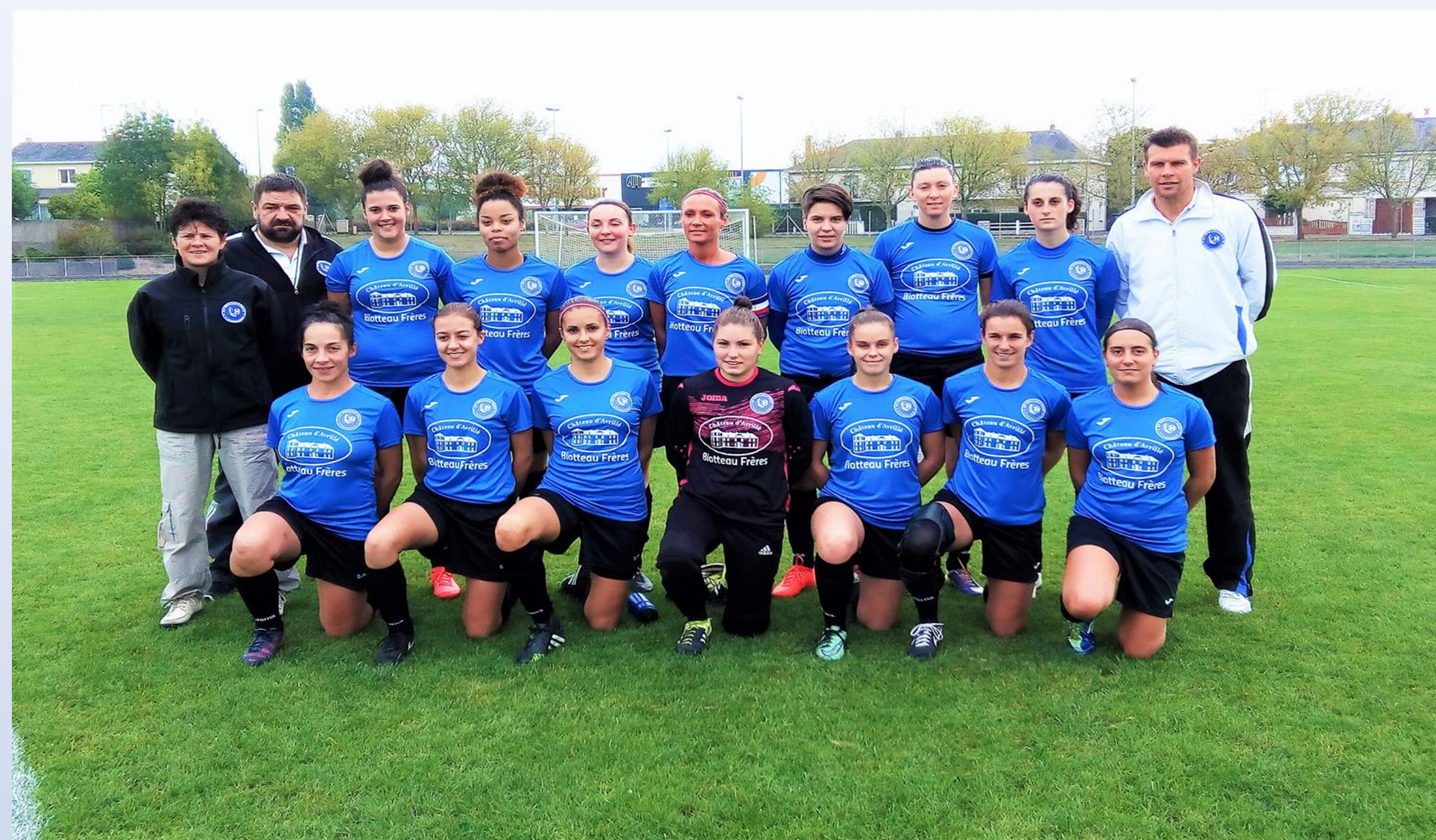
Équipe Senior A