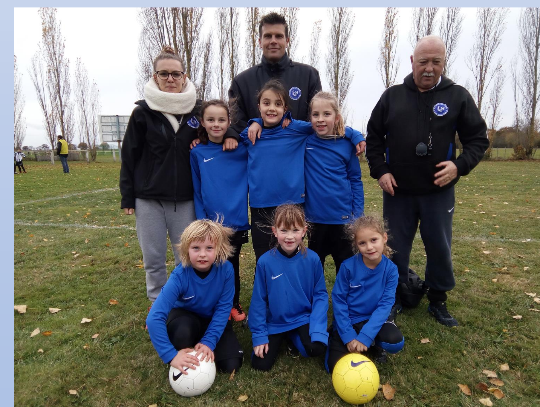
École de Foot