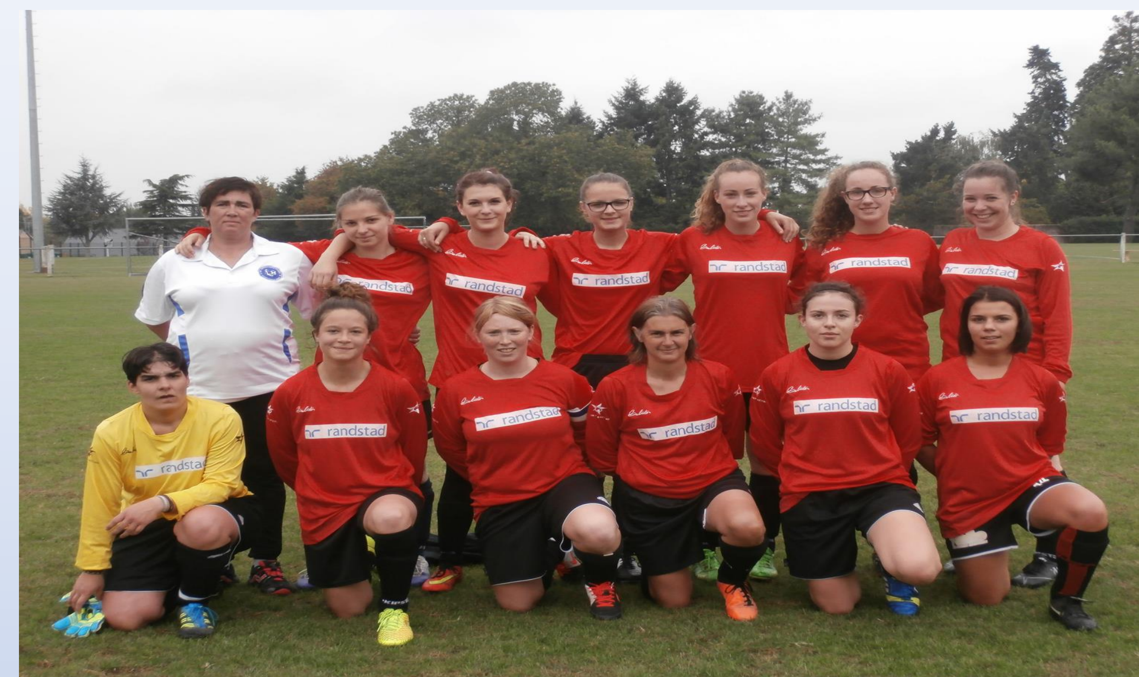
Équipe Senior B